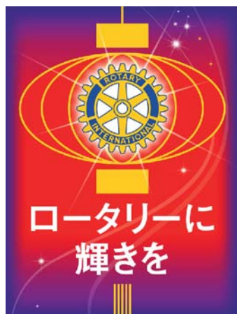
(2014-15年度 国際ロータリー・テーマ)