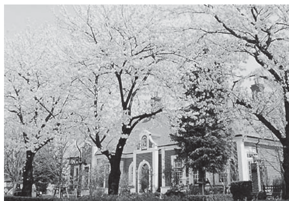
観桜会場 アルバート邸