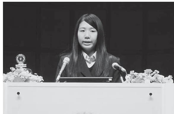
磯崎会員ご令嬢挨拶