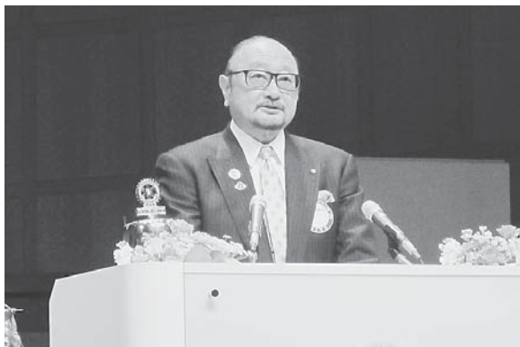
大久保地区総括委員長挨拶