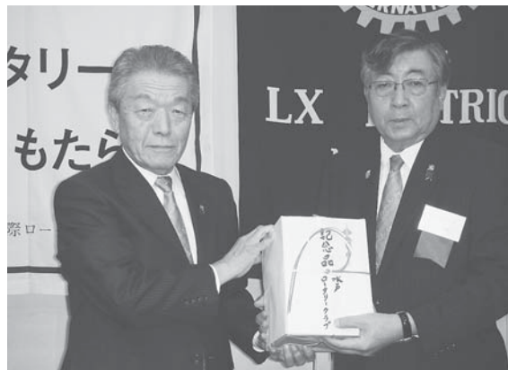
懇親会にて記念品贈呈