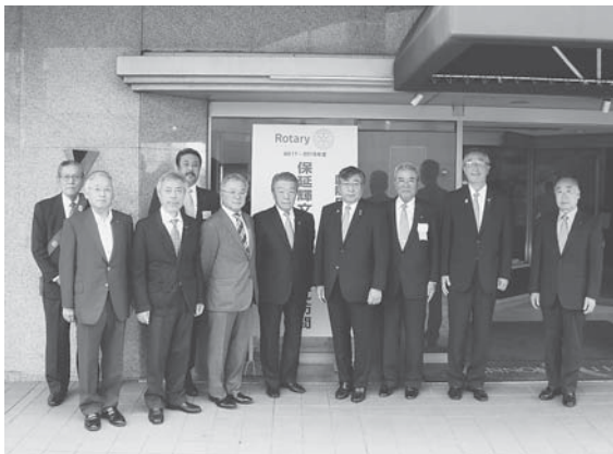
保延ガバナーをお迎えして（会場前にて）