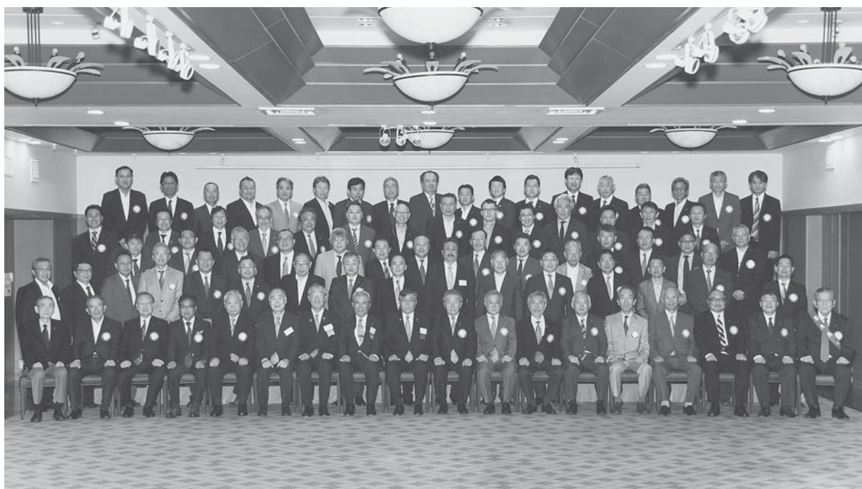
保延ガバナー公式訪問集合写真