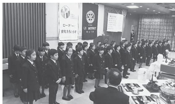
リリーベール小学校 1年生 55名