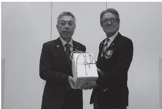
懇親会にて記念品贈呈