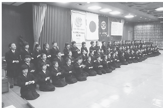
リリーベール小学校 1年生 82名