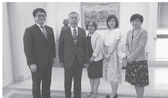
会長・幹事・事務局