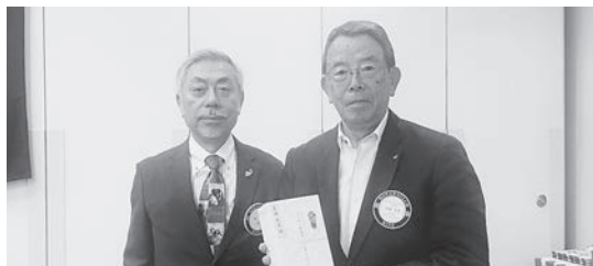
マルチプル・ポール・ハリス・フェロー 五條会員