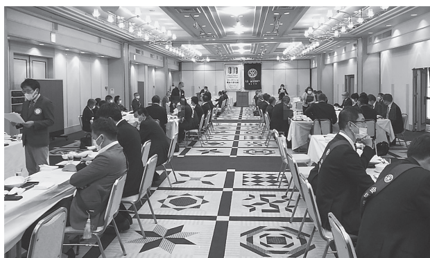
ディスカッション風景