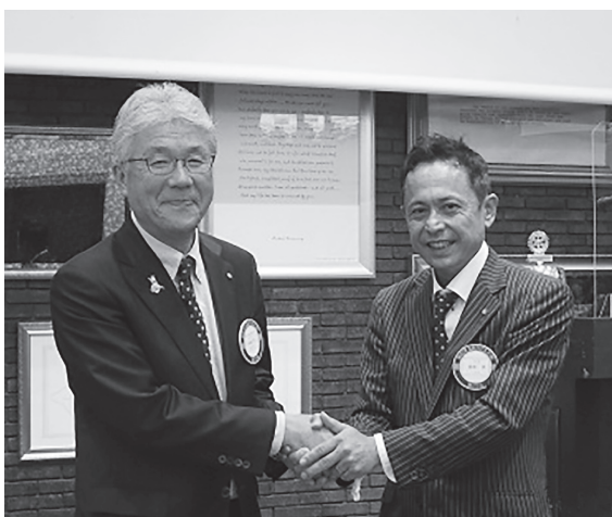
1年間ありがとうございました