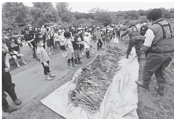
6月6日 ビオトープの造成（千波湖畔）