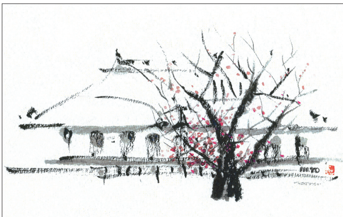
「梅香る弘道館」(水戸市)