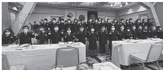
クリスマスソングのプレゼント