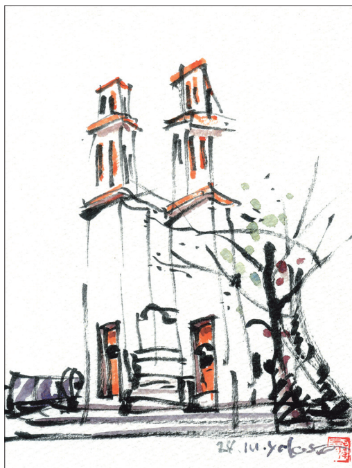
「那珂湊反射炉跡」(ひたちなか市)