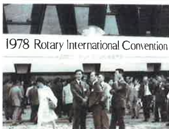
1978 Rotary International Convention