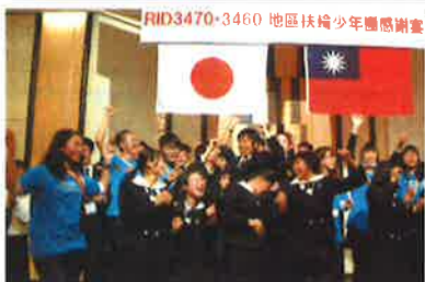
台湾インターアクターとの交流